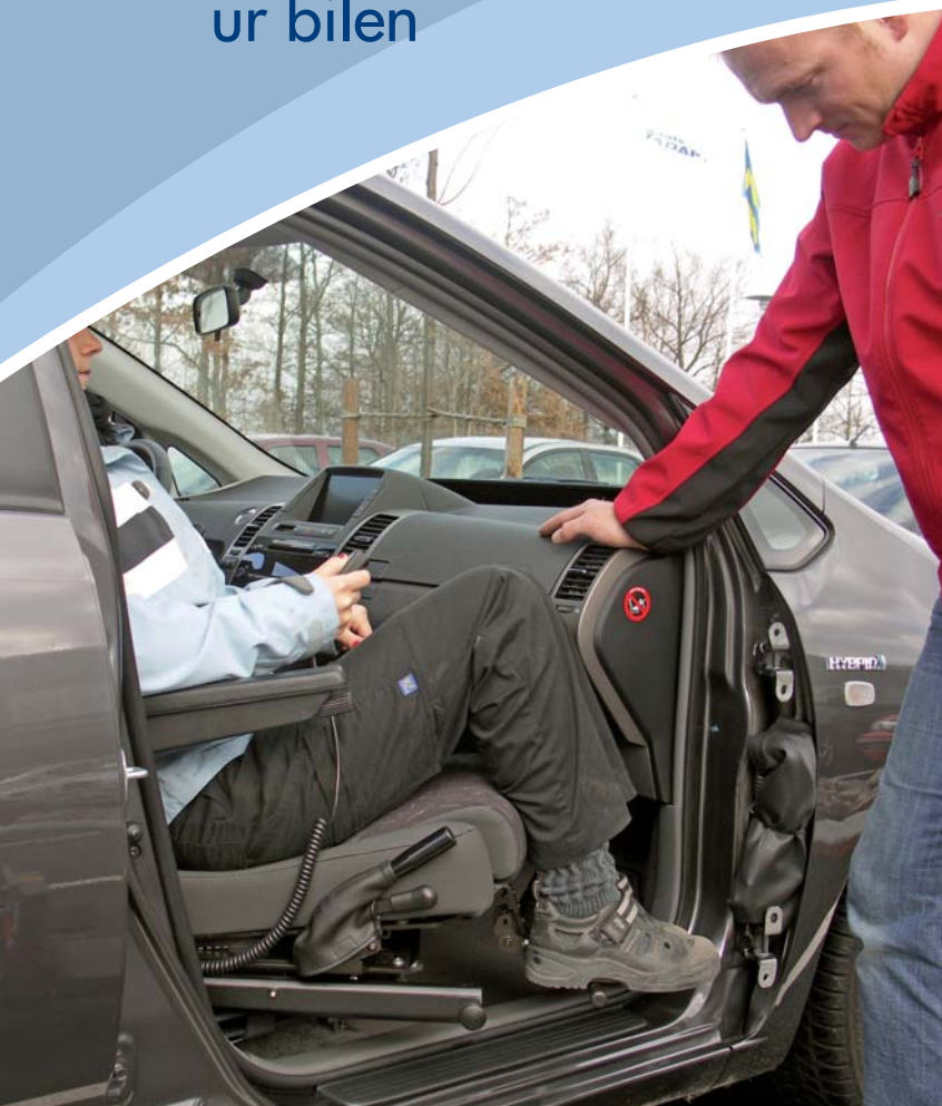
Med fötterna på fotstödet behöver de inte lyftas in.

tiltar stolen och gör det ännu lättare att komma in och ut ur bilen