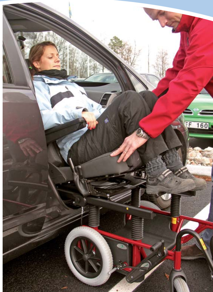
Tilda i kombination med Carony.