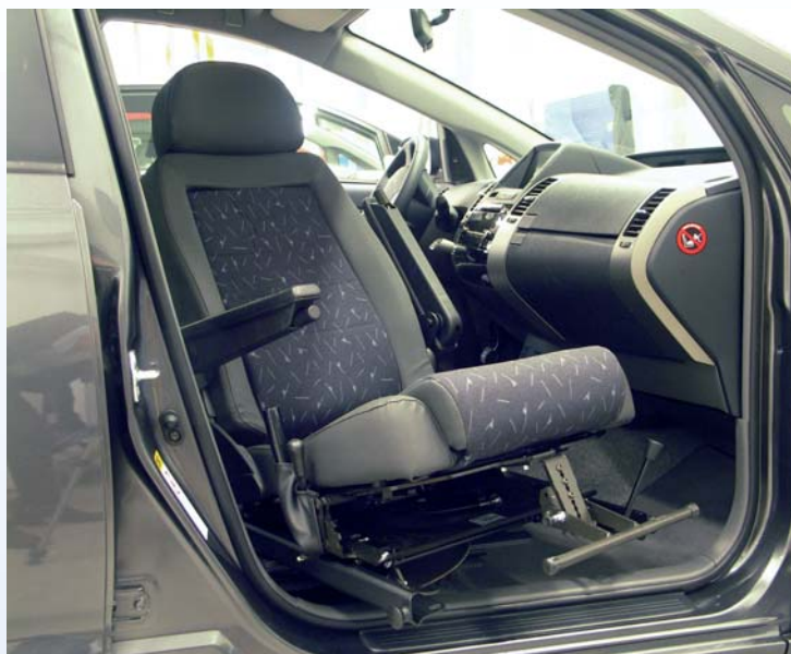
Tilda i position 3 och i kombination med TURNOUT vridplatta, med Carony skenor monterade på sidorna. Fotstödet är ett tillval.