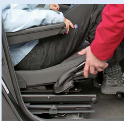
Quand on saisit les deux poignées, les blocages se libèrent et le fauteuil peut être redressé.