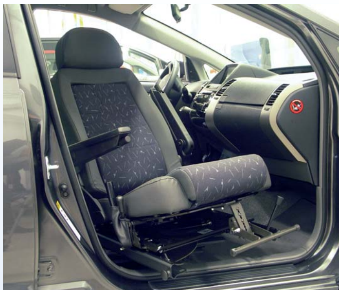
Tilda in Position 3 und in Kombination mit der Schwenkplattform TURNOUT, mit montierten Carony-Schienen an den Seiten. Die Fußstütze ist als Zubehör erhältlich.

Die Fußstütze ist als Zubehör erhältlich.