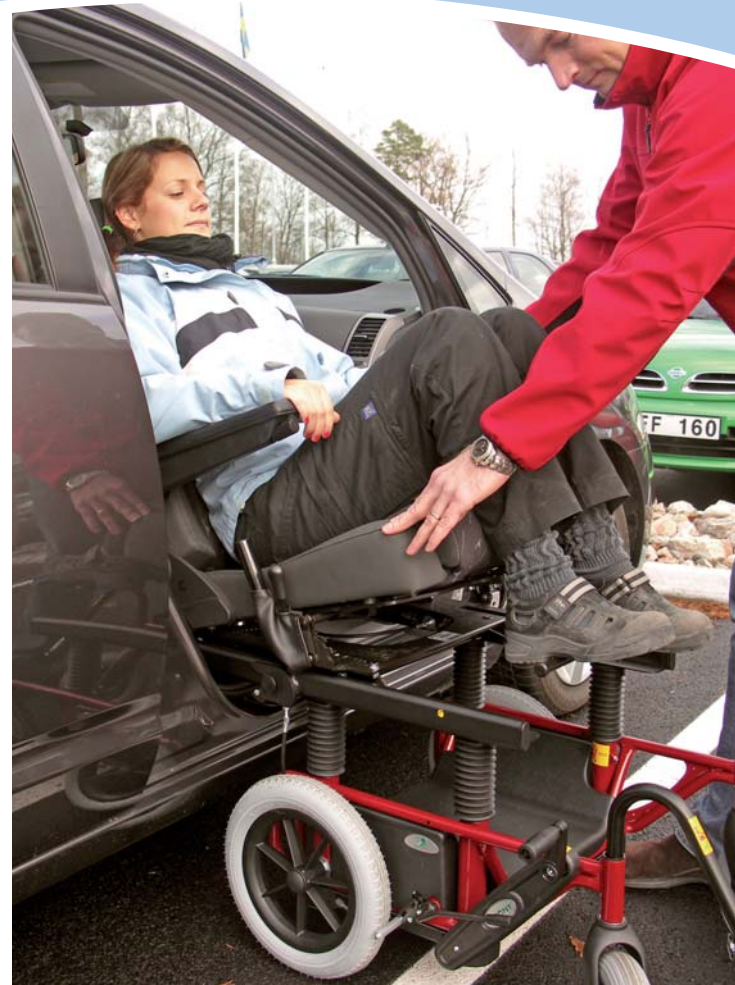
Tilda in Kombination mit Carony.